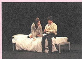
第19期生公演

3/5(土) 19:00、3/6(日) 14:00。 1,200円(当日300円増)。全席自由。 アイホール(072-782-2000)