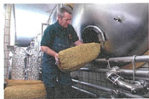
オルヴァル醸造所 ドライホッピング作業