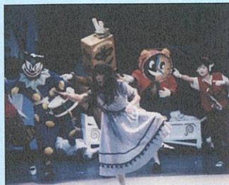
ブリキの自発団『夜の子供』 (1989年 於アイホール)

現代演劇レトロスペクティヴ 〈特別企画〉 AI・HALL+ 生田萬 『夜の子供2 やさしいおじさん』