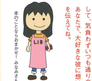
本のことならおまかせ！みなみさん