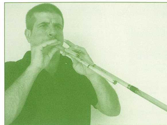
民俗楽器「ラウネッダス」