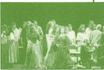
第16回公演「カルメン」より

誰もが耳にしたことがある前奏 曲で始まるカルメンは、世界の 歌劇場で上演されているオペラ の中でも超人気オペラ。自由と 自立を求め続ける情熱的な女性、 カルメン。彼女との出会いによ って人生の歯車を狂わせたホセ。 明るく活気に満ちあふれた色彩 的な音楽にのせて、ドラマが始まろうとしています。 伊丹市民オペラをご期待ください。