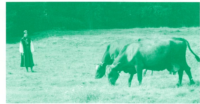
ロックロップの歌を聴き付け、牛たちが森から戻る

<一般>前売3,000円/当日3,500円 <学生>前売2,000円/当日2,500円 ※全席指定