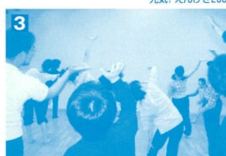
昨年のワークショップ「バントマイム1日体験」