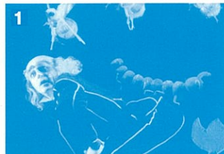
トゥインクルトゥインクル リトル フィッシュ