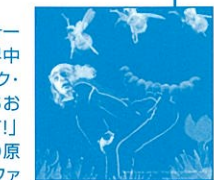
ランブルフィッシュ

オーストラリア ウィンドミル・パフォーミング・アーツ初来日公演。世界中の子供たちに愛されているエリック・カールの人気絵本「はらぺこあおむし」「ね、ほくのともだちになって!」「ババ、お月さまとって!」などの原作をもとにして繰り広げられるファンタジックな舞台。主人公のおむしが蝶になるまでの物語を中心に、ハチやバッタなどの小さな生物からライオン、巨大な象にいたるまでさまざまな生き物が登場し、70を超えるパペットで描かれます。輝く星たちであふれる地上と神秘的な海中の世界を、言葉を使わずに音楽のみで綴ります。小さなお子さまから大人までを対象とした「動く絵本」の世界をお楽しみください。