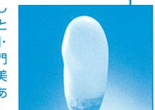
2001グラスクラフト トリエナーレ佐竹ガラス大賞作品

ガラス素材の浸透とガラスの新しい魅力を引き出すことを目的として「安らぎ」をテーマに装飾部門・テーブルウェア部門・オブジェ部門にわけて公募します。ガラスの美が表現されたオリジナルティあふれる作品をお待ちしております。