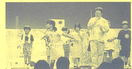
「元気! えんげき」(昨年)より