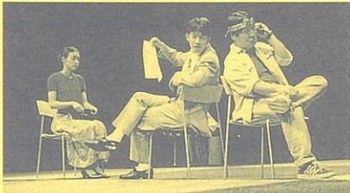
第2期生公演「明日来るひとびと」より