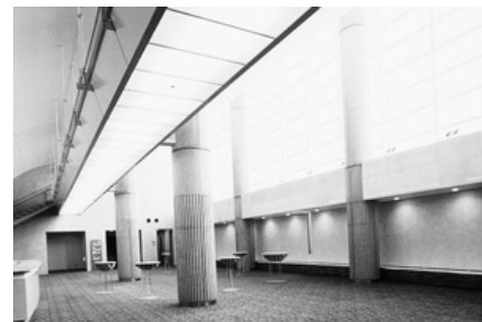
大ホール ホワイエ ↑

募集期間 2024年4月7日(日)~4月29日(月祝) ※初日のみ13時から受付